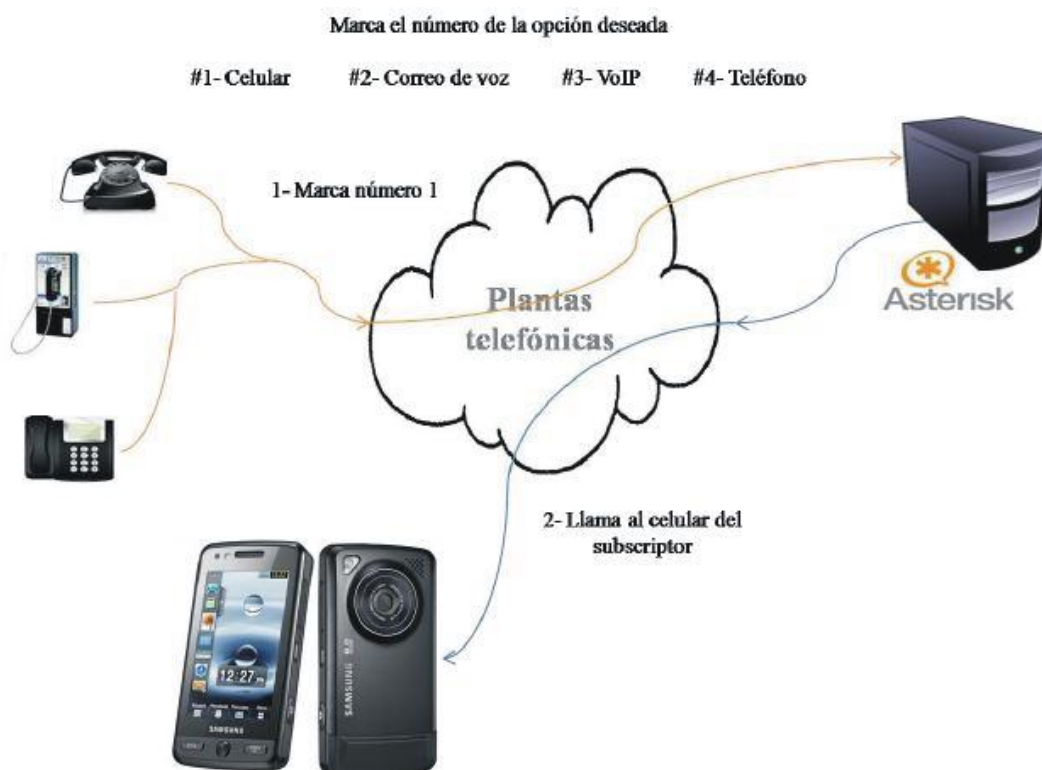
Figura 3. Asterisk conecta los canales.

Si el número marcado no está asignado a ningún contacto, es decir, si marca un número mayor que la cantidad de contactos que tiene asignado el TIP del suscriptor, entonces el AGI envía por el canal el mensaje de voz: “La opción marcada es incorrecta, marque nuevamente la opción deseada” y reproduce nuevamente la locución construida anteriormente con las opciones para cada contacto del suscriptor. Si el abonado marca 3 veces consecutivas una opción incorrecta, entonces el AGI reproduce el mensaje: “Ha excedido el máximo número de intentos” y cuelga la llamada.